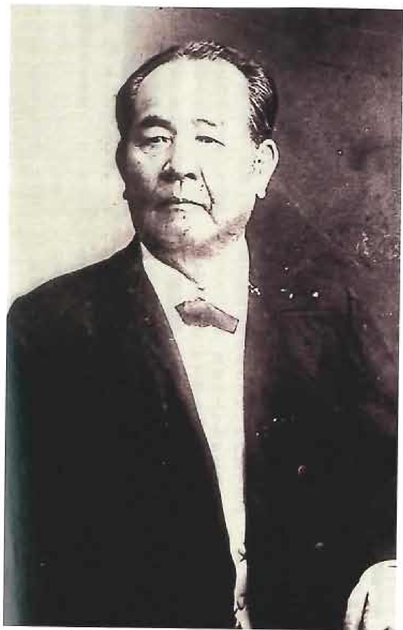
渋沢 栄一 (しぶさわ・えいいち)

1840年、現在の埼玉県深谷市に生まれる。 幕臣となり、67年徳川昭武に随行してヨーロッパ諸国を歴訪。 維新後の69年、明治新政府に仕官。民部省、大蔵省に属した。 73年、大蔵省を退任後、第一国立銀行(現・みずほ銀行)をはじめ 約500社もの企業、600もの社会公共事業の創設に参与し、商工業の発展に貢献した。 また、経済団体を組織し、商業学校を創設するなど実業界の地位向上に努めた。 1931年没(享年91歳)。